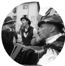
I COSCRITTI DI PREMANA

Sabato e Domenica possibilità di lezioni telemark anche per i più giovani con il TELEMAR KIDS PROJECT!